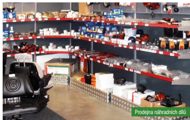
Prodejna náhradních dílů